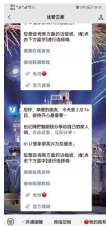
2.点击公众号下方 “微信控制”