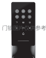
6. 验证管理员信息，按#键结束（初始密码为123456，初始化状态需要重置密码后使用）