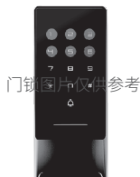
5.验证管理员信息，按#键结束(初始密码为123456，初始化状态需要重置密码后使用)